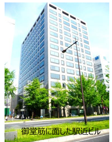
御堂筋に面した駅近ビル