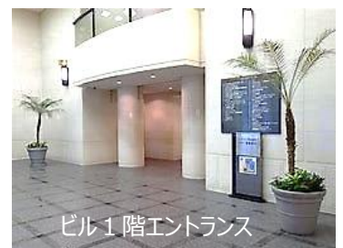
ビル1階エントランス

2022年11月1日より株式会社アール&キャリアから アイング株式会社へ変わりました