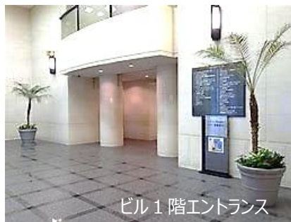
ビル1階エントランス