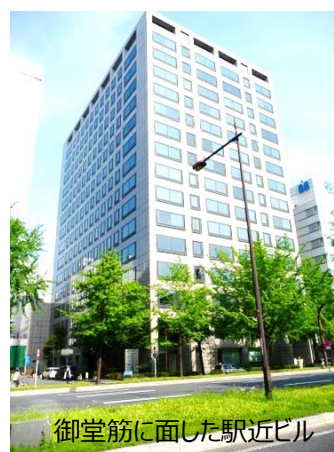
御堂筋に面した駅近ビル