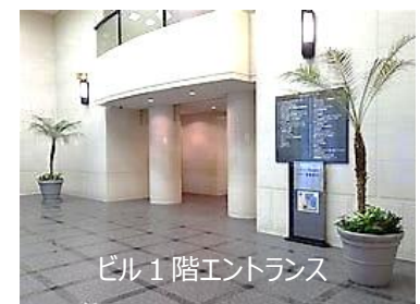
ビル1階エントランス